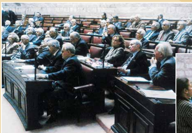
Από την Γενική Συνέλευση της Ενώσεως που πραγματοποιήθηκε στην αίθουσα της Βουλής των Ελλήνων, στις 29 Μαΐου 2005