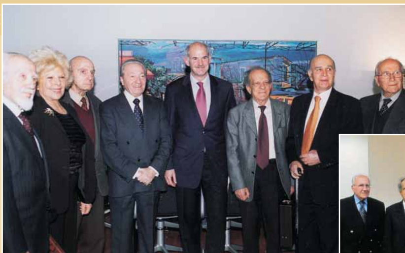
Ο αρχηγός της Αξιωματικής Αντιπολιτεύσεως κ. Γ. Παπανδρέου με τον Πρόεδρο και τα μέλη του Δ.Σ. της Ενώσεως

Από την επίσκεψη του Υφυπουργού Υγείας κ. Αθ. Γιαννόπουλου στα γραφεία της Ενώσεως. Το Δ.Σ. περίπου σε πλήρη σύνθεση