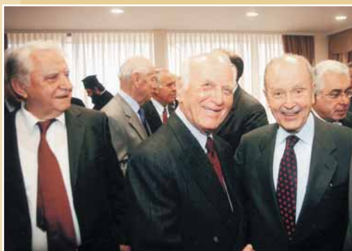
Ο πρώην Πρόεδρος της Δημοκρατίας κ. Στεφανόπουλος με τους τέως βουλευτές κ.κ. Λιβάνη και Δελημίτσο. Ακριβώς πίσω από αυτούς διακρίνονται οι κ. Αρ. Παυλίδης Υπουργός Αιγαίου και ο πρώην Πρόεδρος της Ενώσεως κ. Ζαπάρτας