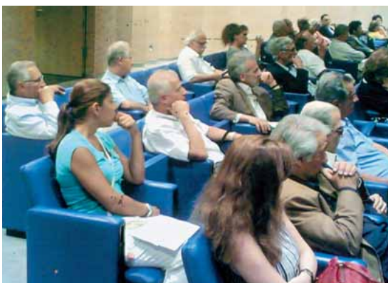
Μία ακόμη άποψη της αιθούσας της εξαιρετικά ενδιαφέρουσας Ημερίδας της Ενώσεως