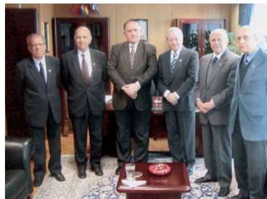
Κατά την εθιμοτυπική επίσκεψη του Δ.Σ. στο νέο Πρόεδρο του Ελεγκτικού Συνεδρίου κ. Κούρτη

Οι δύο Πρόεδροι ζήτησαν να ανταποδώσουν την επίσκεψη των μελών του Δ.Σ. εις τα γραφεία της Ενώσεως, στην οποία, όπως τονίσθηκε από τον κ. Πυλαρινό, θα είναι πάντα τιμητικά καλοδεχούμενοι.