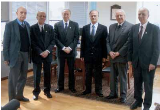
Συνάντηση με τον Πρόεδρο του Νομικού Συμβουλίου του Κράτους κ. Μπακάλη