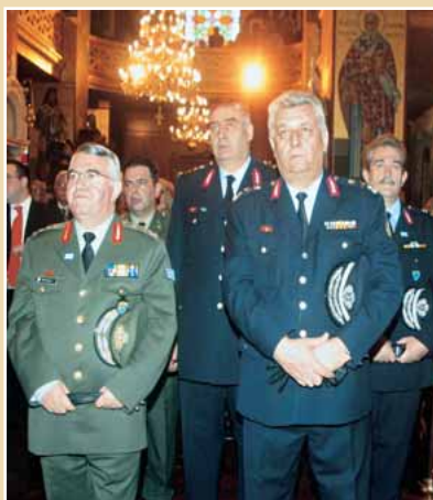
Εκπρόσωποι Στρατιωτικών και Αστυνομικών Αρχών της συμπρωτεύουσας

Παρέστη το σύνολο των Αρχών της Πόλεως, εκπρόσωποι της Πανεπιστημιακής Κοινότητας και των Επιμελητηρίων, κυρίως δε μέλη των οικογενειών των αιμνήστων Συναδέλφων μας.